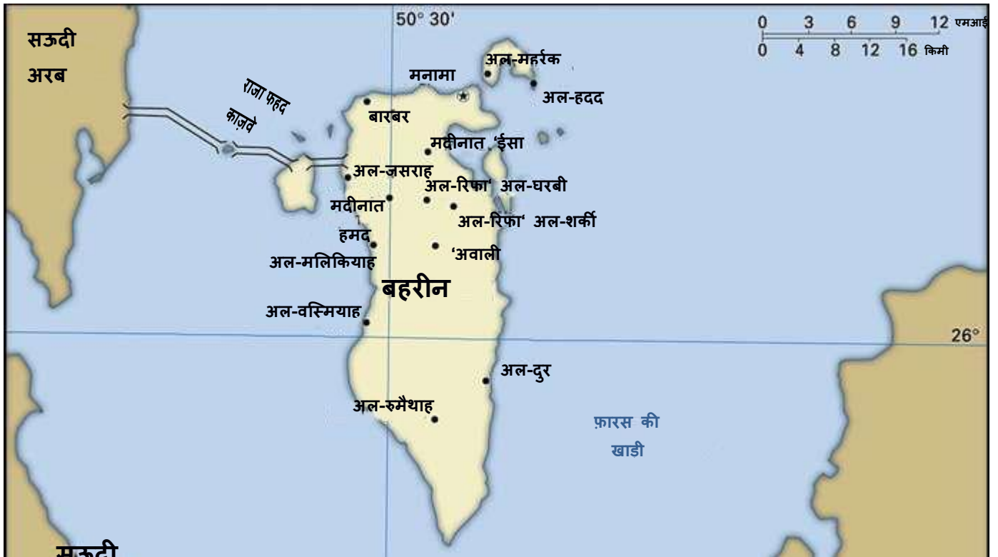
चित्र 1 मानचित्र

बहरीन में 36 द्वीपों का एक द्वीपसमूह शामिल है 10 । इन द्वीपों में से सबसे बड़ा बहरीन है जहां राजधानी मनामा स्थित है। लगभग 700 वर्ग किमी के कुल आकार के साथ, इसका जीसीसी देशों में सबसे छोटा भूमि क्षेत्र है। अधिकांश जनसंख्या शहरी क्षेत्रों में रहती है, जिसमें एक तिहाई से अधिक जनसंख्या दो मुख्य शहरों, मनामा और अल-मुआरक में रहती है 11 ।