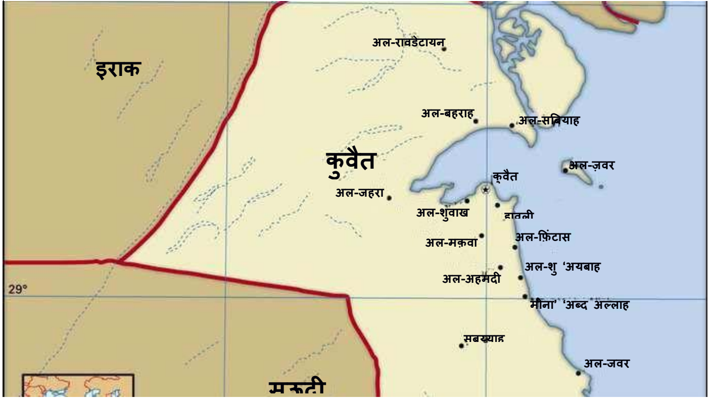
चित्र 2 मैप

फारस की खाड़ी के उत्तर-पश्चिमी छोर पर स्थित है। नौ द्वीप हैं जो कुवैत का भी हिस्सा हैं। ये हैं बुबियान द्वीप, वारबा द्वीप, मिस्कान द्वीप, फेलाका द्वीप, औहा द्वीप, उम एन नामल द्वीप, कुब्बार द्वीप, करुह द्वीप, और उम अल मरादिम द्वीप 60 । राजधानी कुवैत सिटी देश का सबसे बड़ा शहर है।