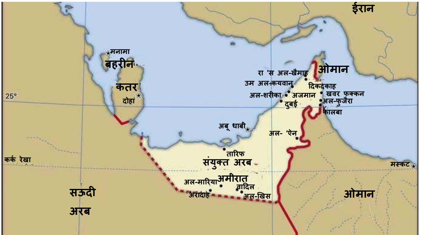
चित्र 5 मानचित्र स्रोत: एनसाइक्लोपीडिया ब्रिटानिका, इंक।

अरब प्रायद्वीप के पूर्वी तट के साथ स्थित, संयुक्त अरब अमीरात (यूएई) सात अमीरात का एक संघ है। अबू धाबी, जिसमें महासंघ के कुल भूमि क्षेत्र का तीन-चौथाई से अधिक हिस्सा शामिल है, अमीरात का सबसे बड़ा है और तेल उद्योग का मुख्य केंद्र है। दुबई इस क्षेत्र का सबसे महत्वपूर्ण वाणिज्यिक और वित्तीय केंद्र है। अन्य छोटे अमीरात शारजाह, अजमान, उम अल-कुवैन, फुजैरा और रास अल-खैमा भी इस क्षेत्र का हिस्सा हैं।